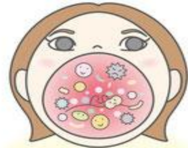
口の中には細菌がいっぱい！

口腔内には腸内同様に口腔内細菌が数百種類、100億以上存在し、口腔内フローラ(細菌叢)を形成しているのです。当然、悪玉菌も善玉菌も存在しています。