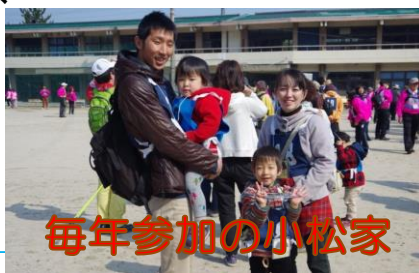
毎年参加の小松家