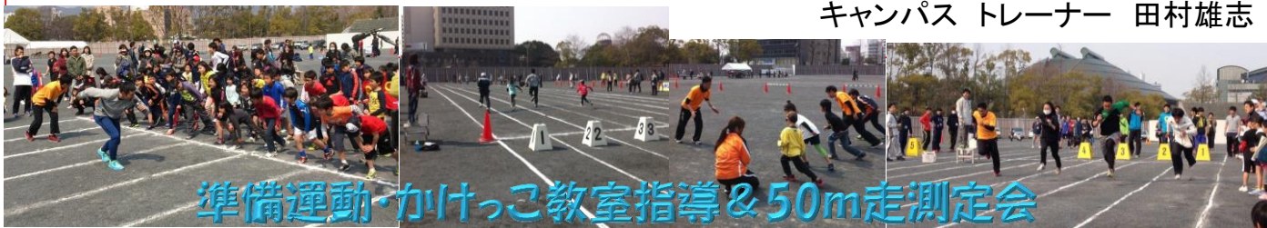
準備運動・かけっこ教室指導&50m走測定会