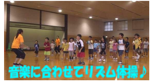
音楽に合わせてリズム体操♪

バランステストは苦手~と嘆いていた子供もいましたが、「ヨーイ、スタート」の合図があると苦戦しながらも頑張ってバランスをとっていましたよ。残りあと4回ありますので、子供たちに体を動かす楽しさを感じてもらえたらと思います。